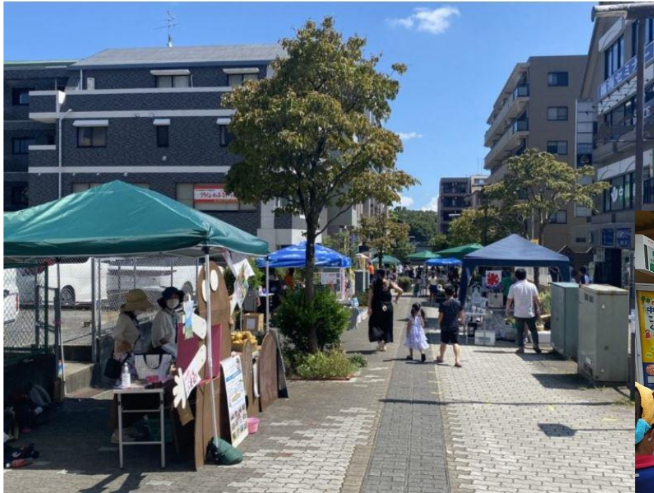
振興会 × I Love つづき × 地域 中川まちなかマーケット