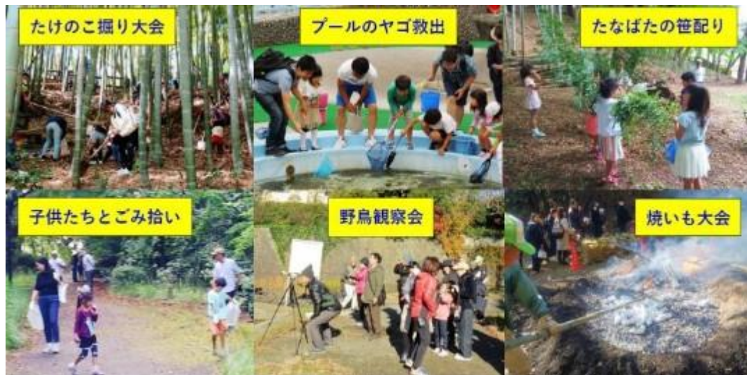
たけのご振り大会