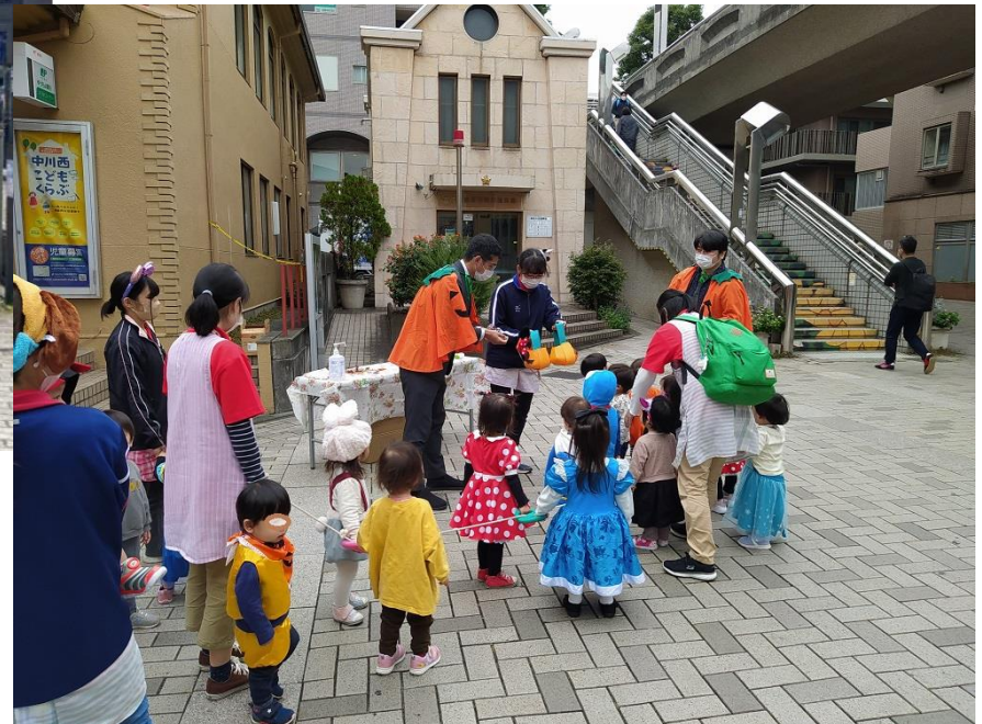
ぐるっと緑道 × 振興会 保育園児のハロウィン中川まち歩き