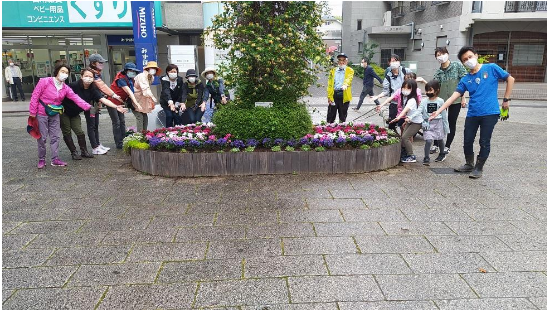
週3回の散水、月1回の花壇整備作業